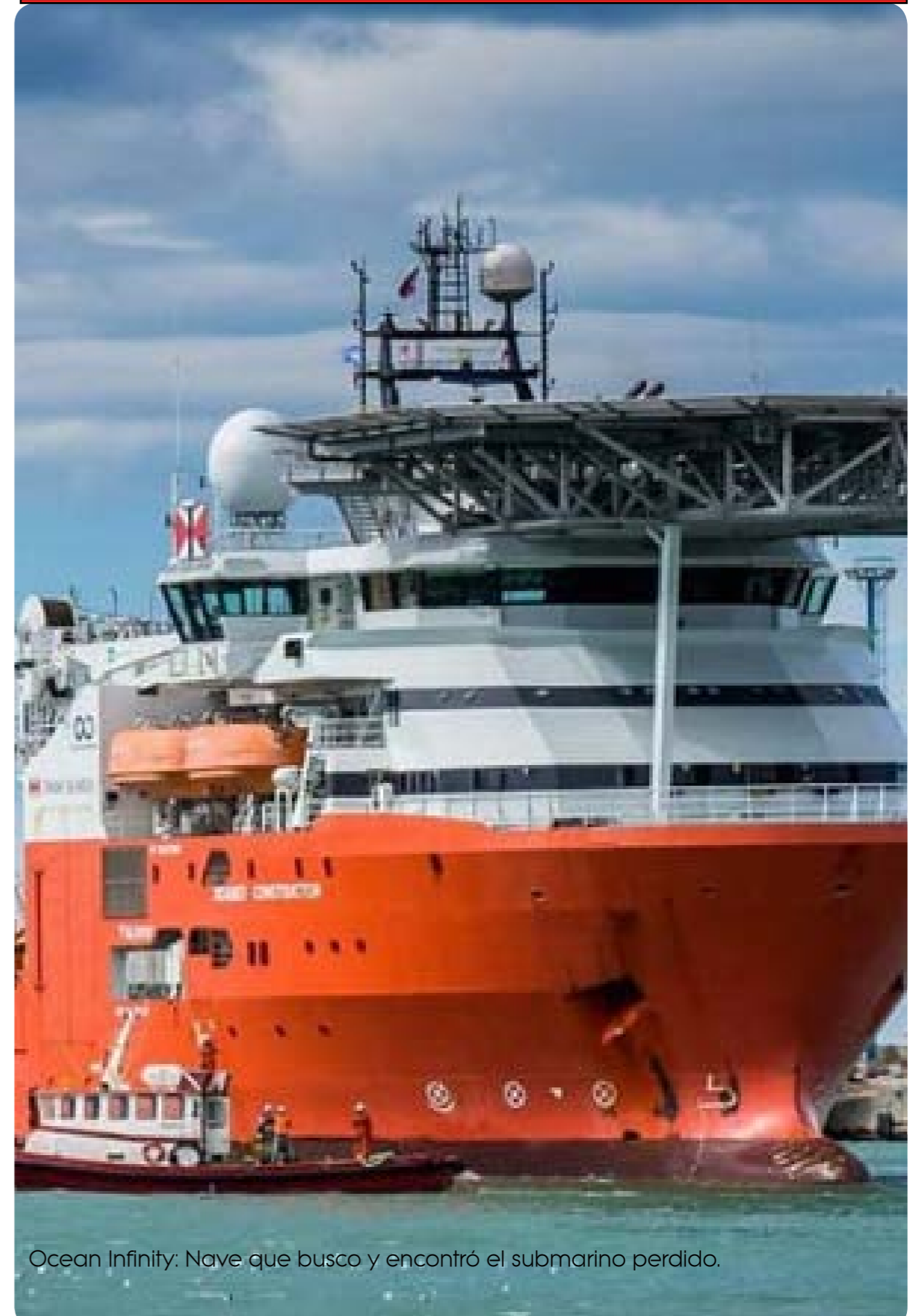
Ocean Infinity: Nave que busco y encontró el submarino perdido.

La información fue ratificada poco después por un breve comunicado de la Armada. "El Ministerio de Defensa y la Armada Argentina informan que en el día de la fecha habiéndose investigado el (Punto Dato) POI 24 informado por la empresa Ocean Infinity, mediante la observación realizada con un ROV (vehículo de observación remota) a 800 mts de profundidad, se ha dado identificación positiva al submarino ARA San Juan", señaló un breve comunicado. Antes de emitir esta comunicación, la Armada le avisó a los familiares de los tripulantes.