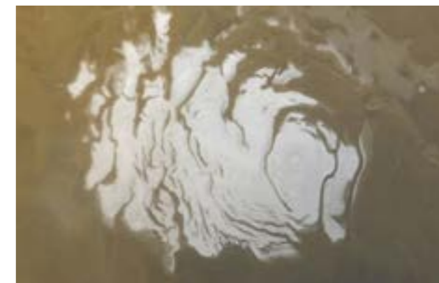
El lago fue hallado bajo una capa del hielo del polo sur de Marte.

Anteriormente la NASA asevero que "Marte tuvo agua y fue caliente durante un período de tiempo que en la Tierra fue suficiente para que emergiera la vida"